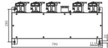
Колонка подключения на 6 точек